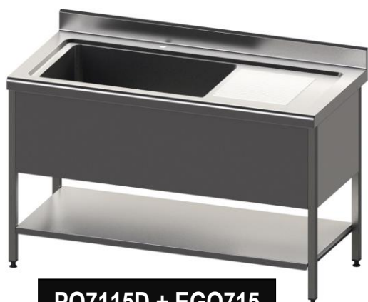
PQ7115D + EGQ715