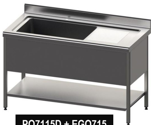
PQ7115D + EGQ715