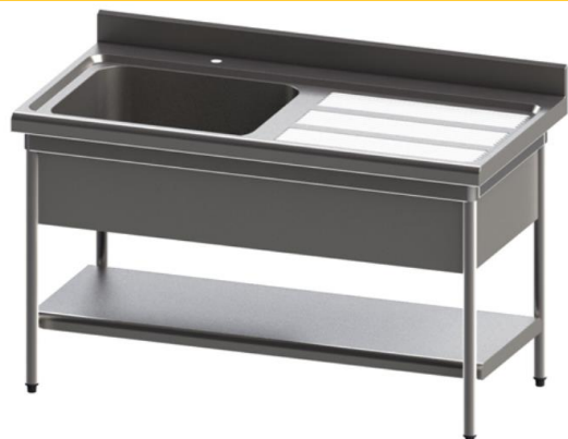
PA112D + EGA