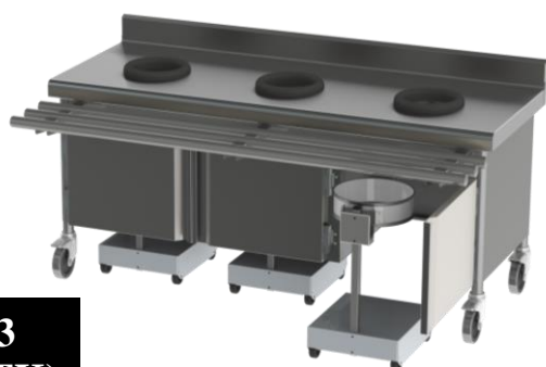
MLTK3 (+ 3 CPBTK)